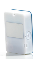
Oeillets de fixation et aimants intégrés