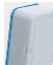
Oeillets de fixation au dos de l'appareil